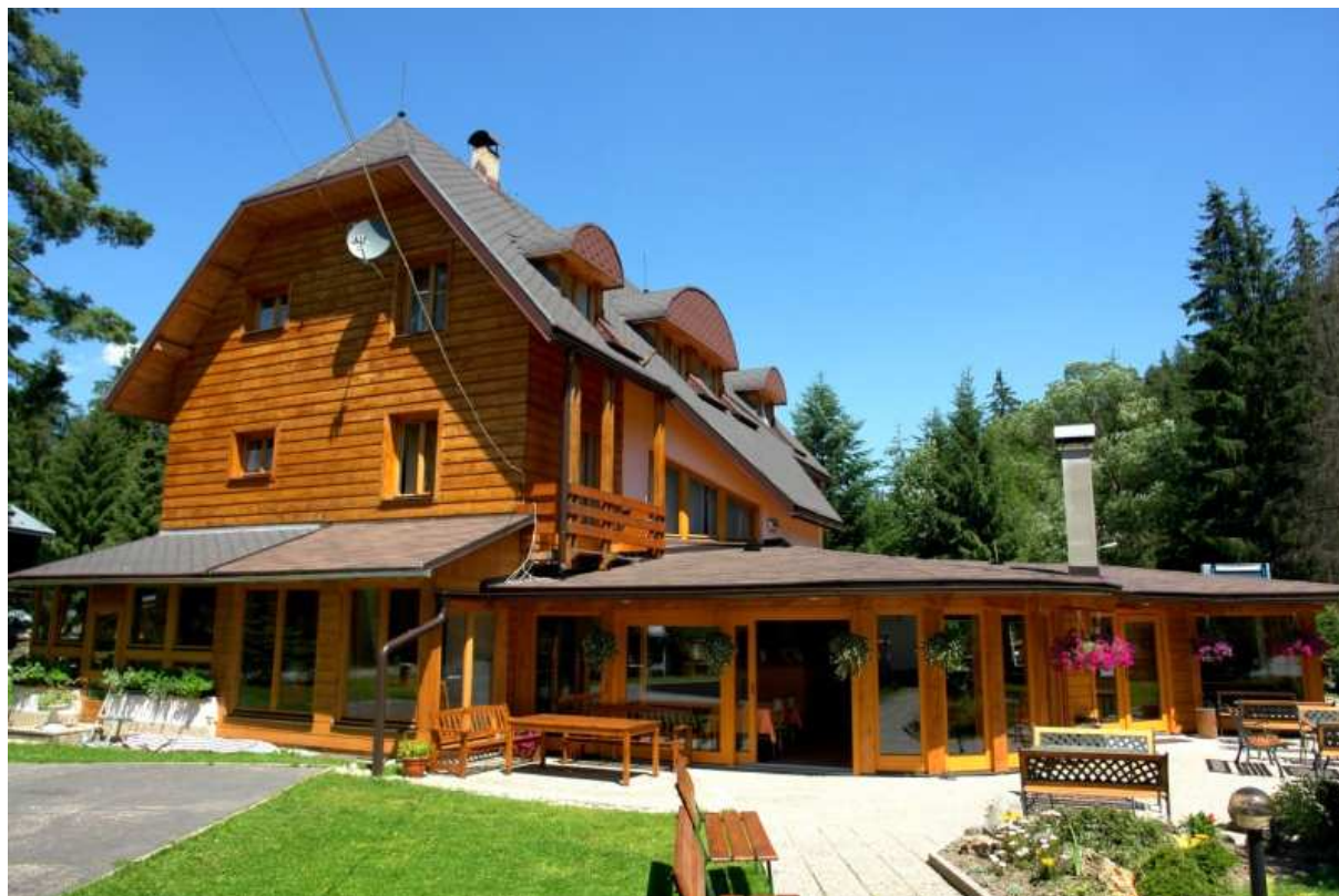
Penzión Limba v Demänovej